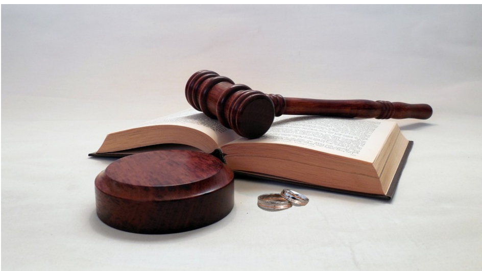
De complexe scheiding